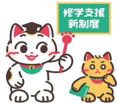
「高等教育の修学支援」公式キャラクター 【まねこ先生（左）とまなびーニャ（右）】

より多くの学生・生徒やその保護者の方々に、本制度のことを知っていただけるよう、 文部科学省と日本学生支援機構 において 次のコンテンツを用意 しています。是非ともご覧いただければと思います。